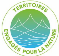
Synthèse des actions possibles (liste non exhaustive)